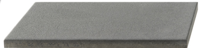
Oberfläche feingestrahlt = seidenmatt/sandig