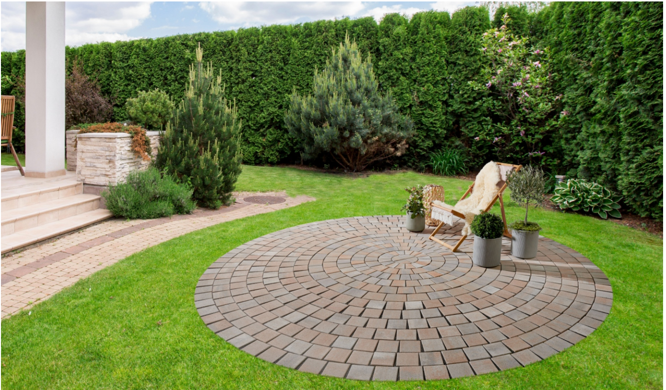
Pflasterkreis Ø 197 cm jura