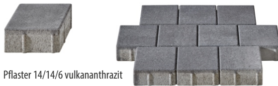
Pflaster 14/14/6 vulkananthrazit