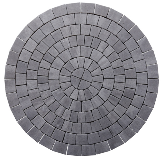
Pflasterkreis-System Ø 197 cm vulkananthrazit (Grundkreis/Set)