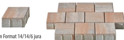
Pflaster im Format 14/14/6 jura