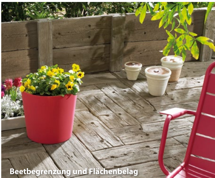
Beetbegrenzung und Flächenbelag